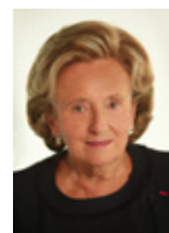
Bernadette Chirac Présidente de la Fondation Hôpitaux de Paris-Hôpitaux de France

Depuis 25 ans, nous avons à cœur de faire de l'hôpital un véritable lieu de vie pour les enfants, adolescents et personnes âgées hospitalisés. Cette année encore, l'équipe de la Fondation continuera, avec la même détermination, de s'engager auprès des hôpitaux, en collant au plus près des besoins qui évoluent en prenant en compte les nouvelles souffrances qu'engendre la société d'aujourd'hui.